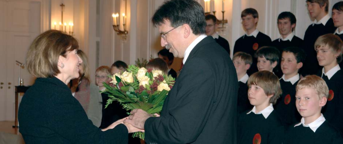
Eva-Luise Köhler dankt mit einem bunten Blumenstraus.

des Schlosses kam Bundespräsident Horst Köhler mit den Buben und jungen Männern der Augsburger Domsingknaben zwanglos ins Gespräch. Immer wieder erkundigte er sich nach dem musikalischen Alltag der Augsburger Domsingknaben, gab interessierten Männerstimmen gute Tipps für das Studium und geizte nicht mit Autogrammen.