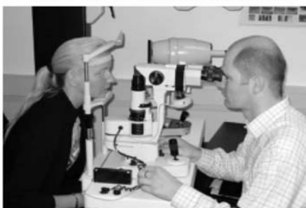
Optimale Anpassung - eine wichtige Grundlage für beschwerdefreies Kontaktlinsentragen!